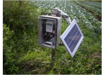
Fig : 現場での最小構成)