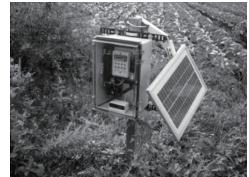
Fig: 現場での最小構成